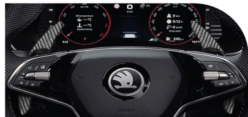
Paletas de cambio al volante