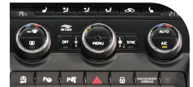
Sistema de climatización