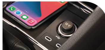
Cargador Inalámbrico Puertos USB tipo C