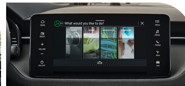
Computador a bordo